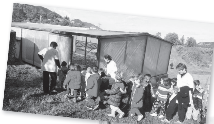
■ Foto's van de kas

In het najaar van 2016 besloot de Nieuwe Kerk in Huizen om de opbrengst van de Zaterdagmarkt-verkopen te doneren aan onze stichting. De opbrengsten waren bestemd voor de bouw van een groentekas op het terrein van ons kindertehuis. Hiermee willen we de kinderen niet alleen dagelijks voorzien van verse groenten, maar tevens landbouwkennis bijbrengen. Nadat wij alle vergunningen hadden gekregen van de Albanese overheid (dat is iedere keer weer een hele, bureaucratische klus) konden wij afgelopen voorjaar beginnen met de bouw van de kas. Inmiddels is de bouw afgerond en het resultaat mag er zijn! Niet alleen is de grote kas prachtig, maar is ook de eerste groenteoogst een mooi resultaat. Wij hopen hier de aankomende jaren enorm veel plezier aan te beleven!