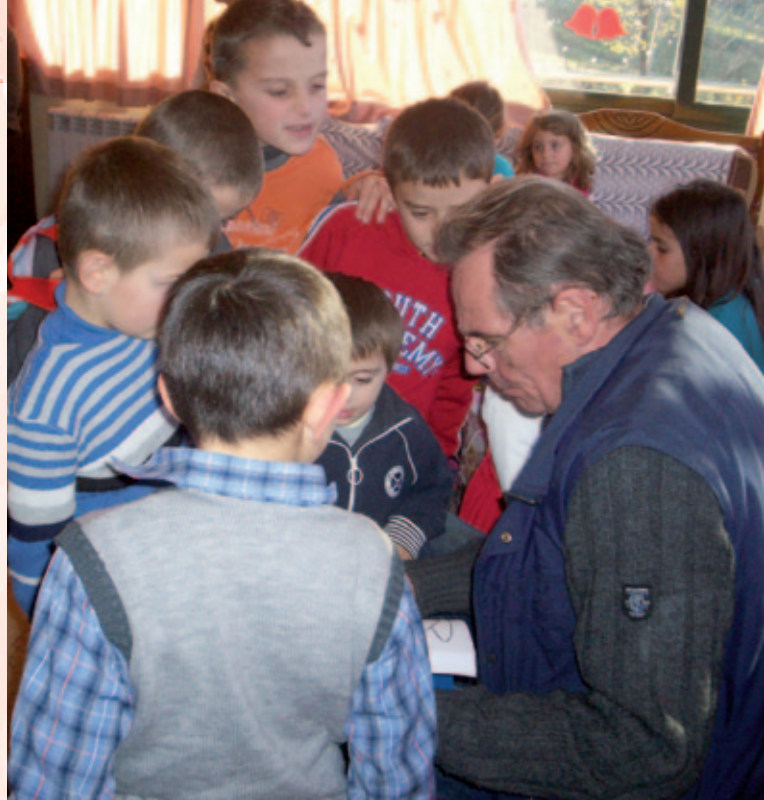
Een warm plekje in zijn hart voor kinderen.

“Natuurlijk heb ik vaak gedacht: ‘Waar zijn we mee bezig?’. Vooral die eerste jaren kwam er helemaal geen geld