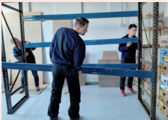
De vrijwilligers van Ep & Vloet installeren de door hen geschonken stellingen in het magazijn aan de Fabrieksweg.