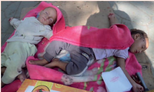
De (kleine) kinderen brachten hun dagen liggend op een stuk karton door, hongerig, verwaarloosd en vaak ook nog ziekelijk.

“Ondanks de grote armoede, was het altijd gezellig bij de zigeunerfamilies van het treinstation. De liefde straalde ervan af. Ze zagen dat wij hun kinderen koesterden en niet wegstuurden. Het maakte ons niet uit hoe ze eruitzagen, terwijl ze eigenlijk te vies waren om aan te pakken. We deelden Bijbels uit, zongen met ze en dat allemaal midden op die vuilnisbelt. Hun woongerrein was mensonterend.