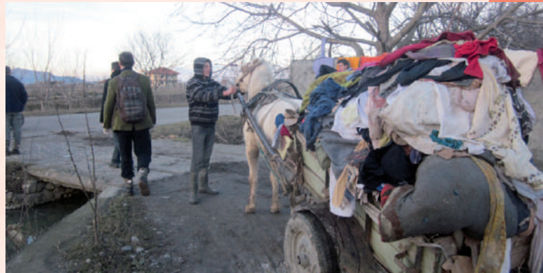
Alleen al in het noorden van Albanië werden meer dan 11.000 mensen geëvacueerd vanuit hun ondergelopen woningen.