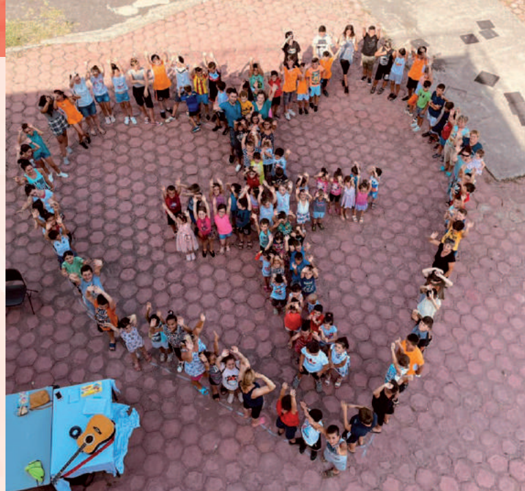
De laatste dag werd op een fantastische manier afgesloten in de vorm van een hart en een kruis, gecreëerd door de kinderen.

De hele week is met de kinderen gesproken over de vrucht van de Geest: liefde, vrede, dankbaarheid, vertrouwen, geduld, vriendelijkheid en nederigheid. Naast de Bijbelverhalen werd dit met de kinderen ook heel praktisch gemaakt naar de tijd waarin zij leven. De laatste dag werd op een fantastische manier afgesloten in de vorm van een hart en een kruis, gecreëerd door de kinderen: liefde en geloof, gezegend om tot zegen te zijn. Ondanks de hoge temperaturen en de daaruit voortvloeiende vermoeidheid, mogen we terugkijken op een fantastische week.