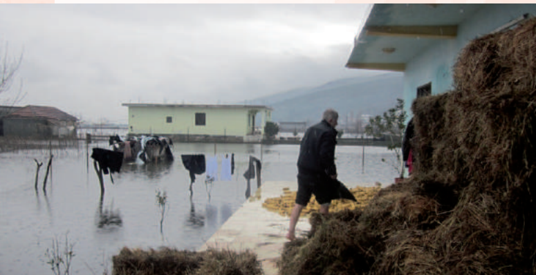
Bij de watersnood in 2010 werd Albanië het hardst getroffen.