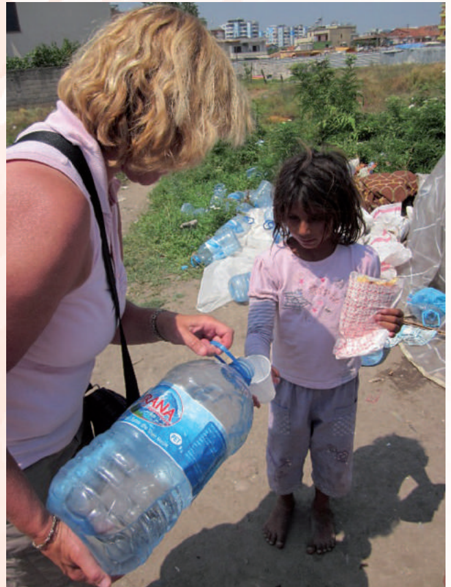
De twee Barmhartige Samaritanen van het Albanië Comité brachten Levend Water en water uit een fles voor de dorst ...

Naast de bewoners van het treinstation, was er in de stad ook nog een soort Big Mama. Deze zigeunervrouw had de zorg over meer dan 20 verwaarloosde zigeuner kinderen. Ze werden allemaal bij haar thuisgebracht en dan nam ze hen 's morgens mee naar het park om te bedelen. Niet alles wat ze deed vonden wij goed, maar ze zei tegen ons: -Hoe moeten we anders rondkomen?-. En dat begrepen we dan ook wel, zodat we haar hielpen waar we konden. De kinderen hoefden onze auto maar te zien aankomen, of ze werden helemaal gek. Als een horde kwamen ze