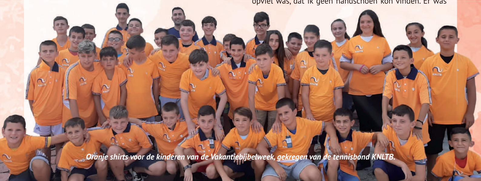
Oranje shirts voor de kinderen van de Vakantiebijbelweek, gekregen van de tennisbond KNLTB.