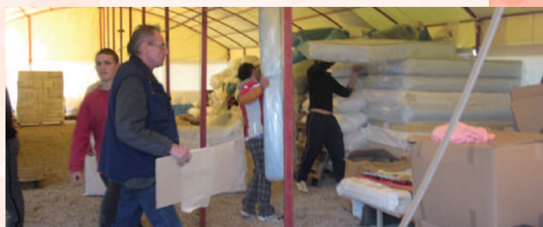
Een noodactie bracht 50.000 euro bij elkaar, zodat het Albanië Comité hulp kon bieden.