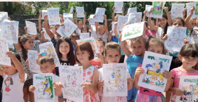
Een prachtige Vakantiebijbelweek, met iedere dag meer dan 100 kinderen.