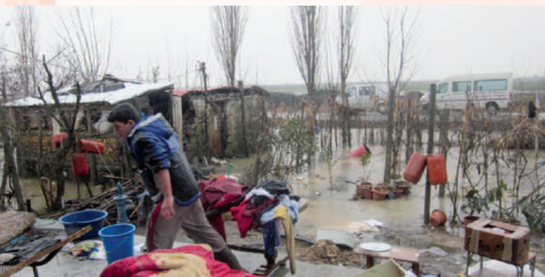
Hele gebieden waren geïsoleerd door het wassende water