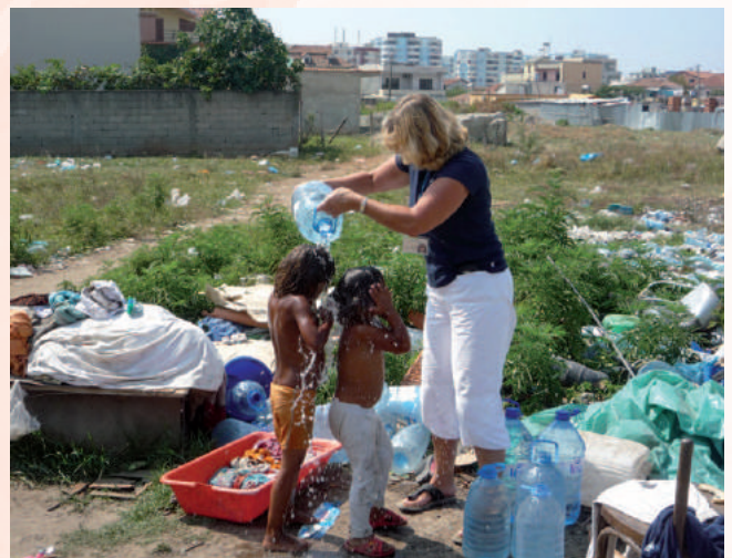
... en ter verkoeling.

op ons af. Ze wilden de auto schoonmaken en dan trakteerden we hen op een pizzapunt of een 'souflaatje'. Dat is een pitabroodje met vlees, groente en saus. En toen het een keer heel warm was, vroegen ze om brood met chocoladepasta. Daar hadden ze zó'n zin in..... Het was toen boven de 46 graden, dus die chocoladepasta