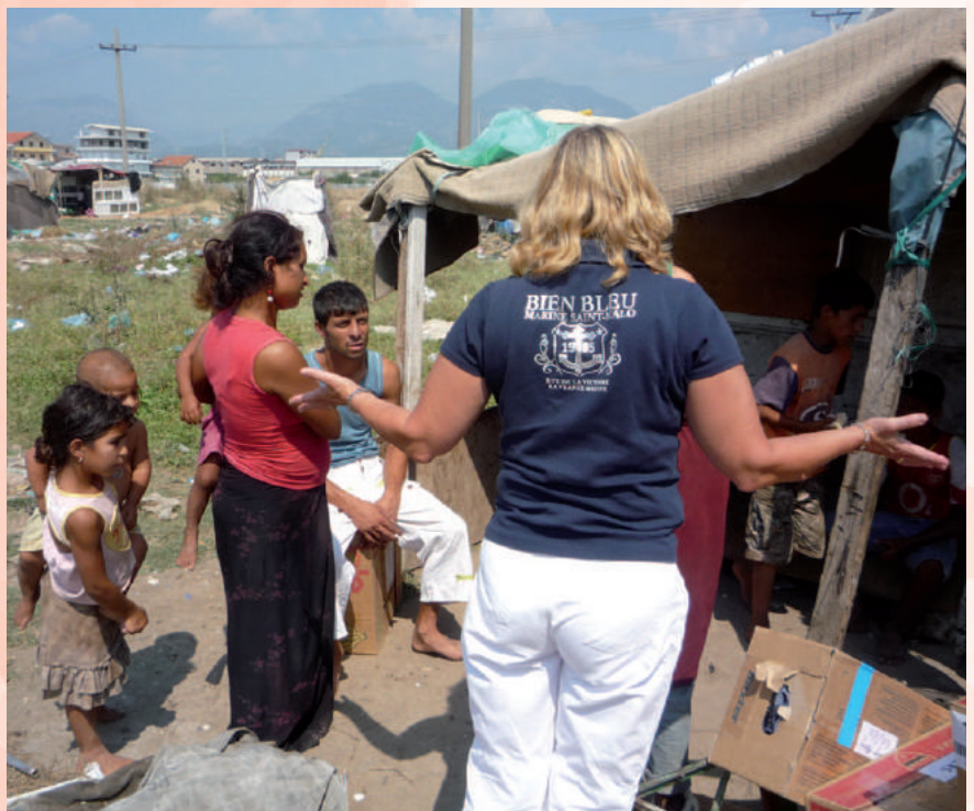
Het treinstation was een vuilnisbelt, waar de zigeunerfamilies bouwketen hadden gebouwd van hout en plastic.

in het kindertehuis, toen het tehuis financieel werd geadopteerd door het Albanië Comité in oprichting. “Toen we voor de straatkinderen gingen zorgen,